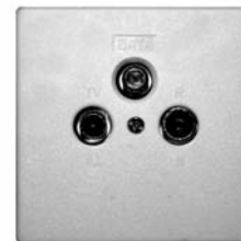
Modernt antennuttag som också kan se ut som på omslaget